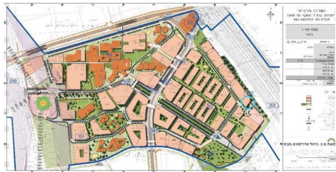
סימון המיקום ע"ג תוכנית הבינוי מתוכנית מס' 455-0631754